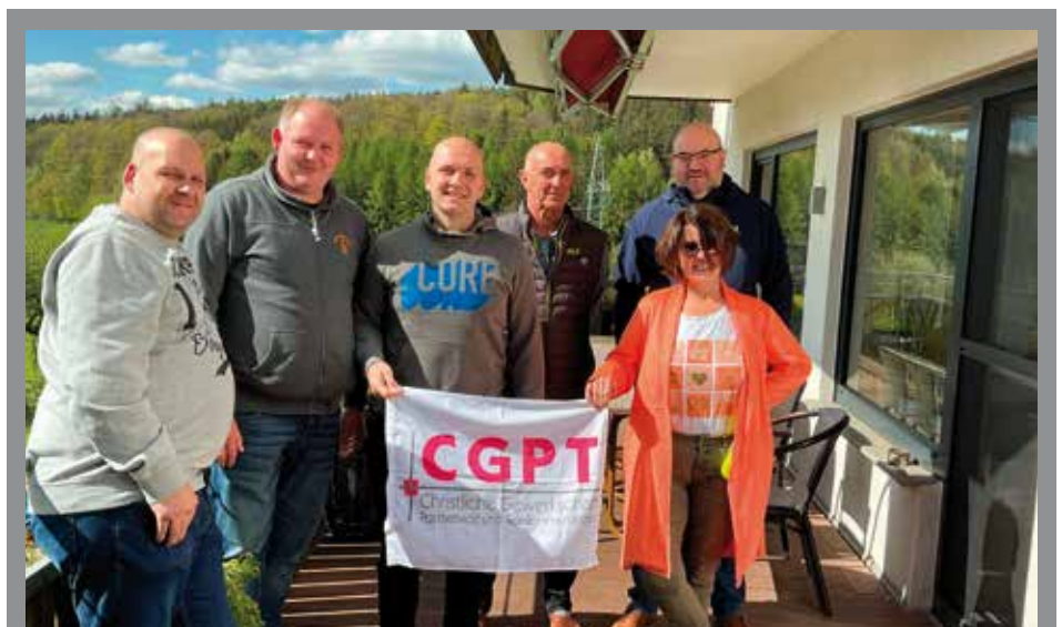
Betriebsratsschulungen finden auch 2024 wieder statt. Hier werden CGPT Betriebsräte zum aktuellen Arbeitsrecht, in Poppenhausen Röhn, geschult. Referent war der CGM Bundesvorsitzende Sebastian Schede

Die dagegen gerichtete Rechtsbeschwerde der Arbeitgeberin hatte vor dem Siebten Senat des Bundesarbeitsgerichts keinen Erfolg. Es steht der Wahl eines Betriebsrats nicht entgegen, wenn sich nicht genügend Bewerber für das Betriebsratsamt finden. Das folgt vor allem aus dem in § 1 Abs. 1 Satz 1 BetrVG ausgedrückten Willen des Gesetzgebers, dass in Betrieben mit in der Regel mindestens fünf ständig wahlberechtigten Arbeitnehmern, von denen drei wählbar sind, Betriebsräte gewählt werden. Bei der Betriebsratsgröße ist in der Konstellation von weniger Kandidaten als zu besetzenden Betriebsratssitzen auf die (jeweils) nächstniedrigere Stufe des § 9 BetrVG so lange