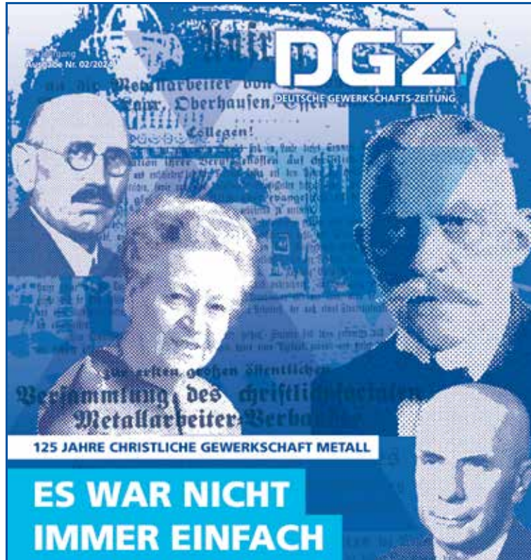
Aktuelle Titelseite der DGZ Ausgabe Juli 2024